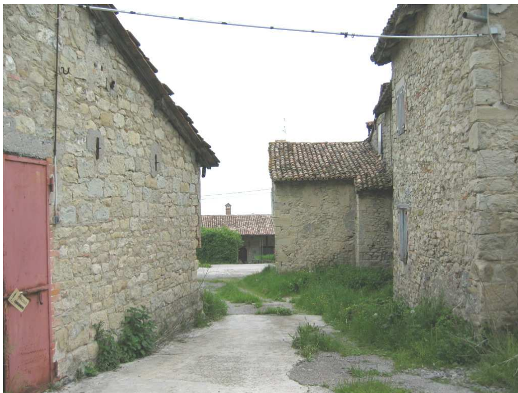
Foto n. 71: Cà Bergantino, sullo sfondo s'intravede l'Aia di Lorenzo