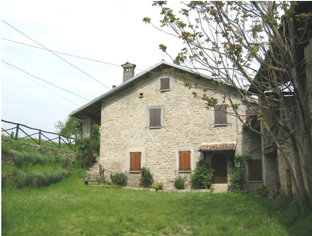
Foto n. 100: Aia di Lorenzo, l'edificio che chiude la corte a ponente è detto Cà Bortolomeo